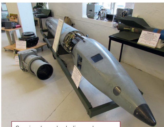
Spaningskapsel och diverse kameror.