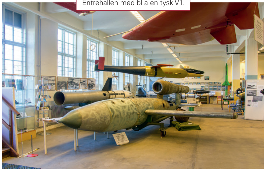
Entrehallen med bl a en tysk V1.

enbart ett rent robotmuseum, inte bara de robottyper som "CVA" varit inblandade i, utan samtliga vapengrenars robotar; alltså såväl armé-, marin- som flygrobotar.