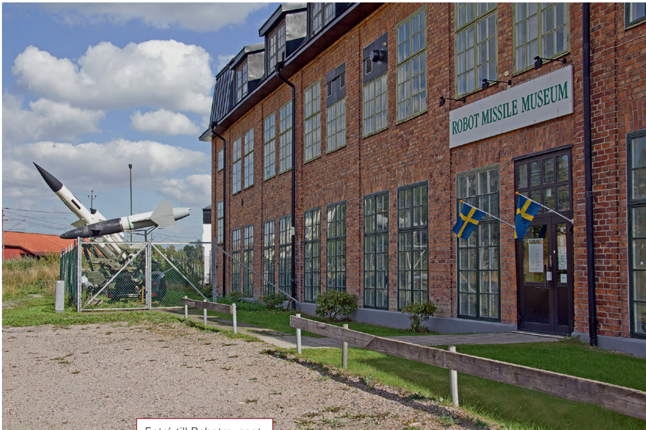
Entré till Robotmuseet.

Arboga Robotmuseum drivs av en ideell förening, Robothistoriska föreningen i Arboga, och har sin upprinnelse i ett 50-års jubileum 1995 vid dåvarande FFV Aerotech (CVA) där en av cheferna på robotavdelningen förberedde för en familjedag för att där uppvisa då moderna och även historiska robotar som "CVA" arbetat med sedan 2:a världskrigets slutskede och framåt.