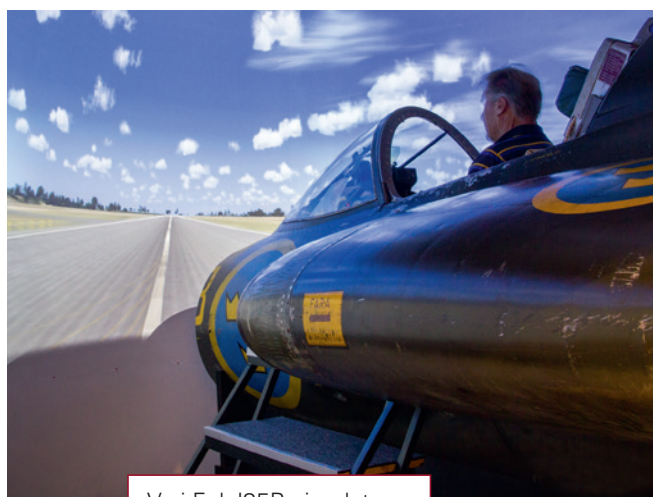
Vy i Fpl J35B-simulaton.